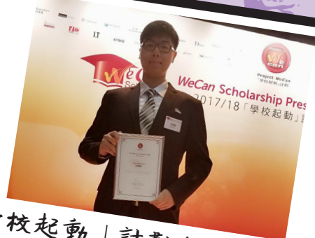
「學校起動」計劃大學獎學金