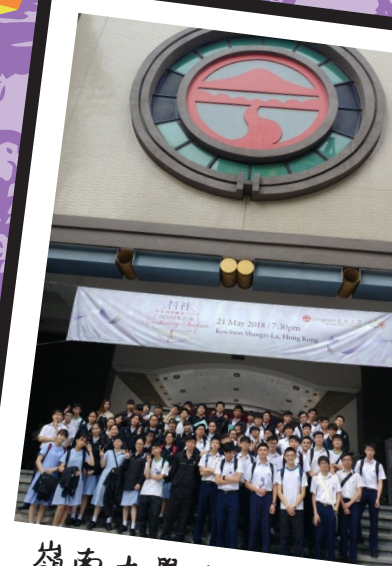
嶺南大學生活體驗日