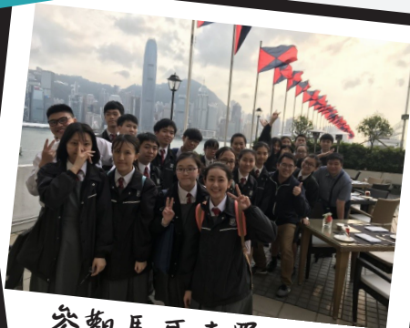
參觀馬哥孛羅酒店