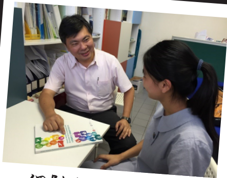
個別生涯規劃輔導