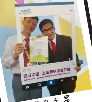
明日之星 上游獎學金嘉許禮