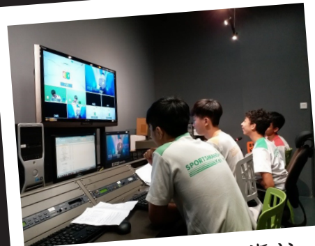
職業路向探索工作坊