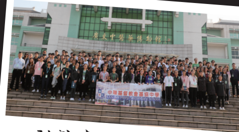
到訪廣州中醫藥大學

本校設有多項獎助學金，其中校友會為升讀大學之學生提供資助，本年度受惠學生多達二十九人。