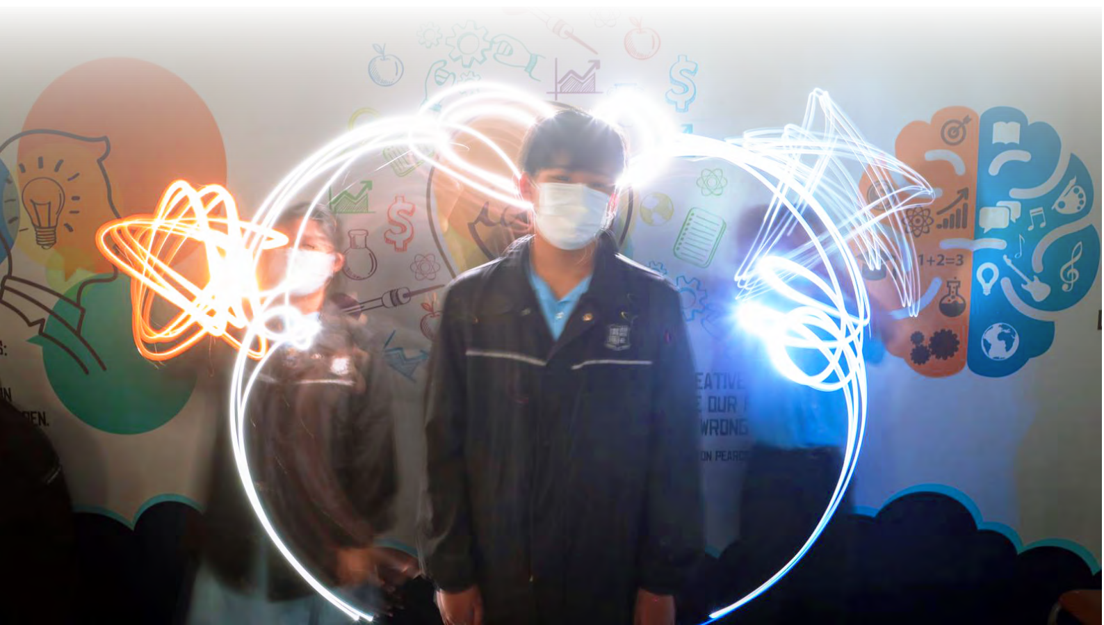
學生創作的光影塗鴉作品（來自星星的你）