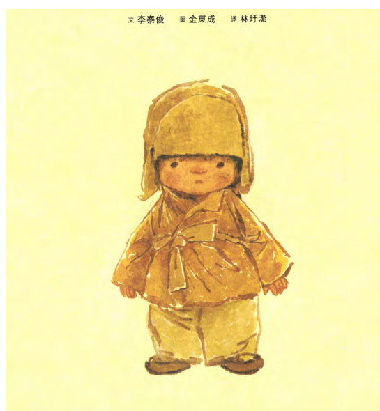
《媽媽還沒回來嗎？》繪本封面。

國語文除以訓練學生讀、寫、聽、說四項能力為課程目標外，還以培養學生品德情意為核心目標，期望在完成課程後，學生能夠具備應有的品德情意。當中，品德情意範疇包含以下的核心素養：培養道德認知及自省能力、建構積極的人生態度、提升對家國及世界的責任。為培養學生以上的核心素養，筆者針對任教學生的特性（對語文學習不感興趣），以繪本作為材料，並輔以不同的活動，引導學生思考繪本所蘊含的品德價值，做法如下：