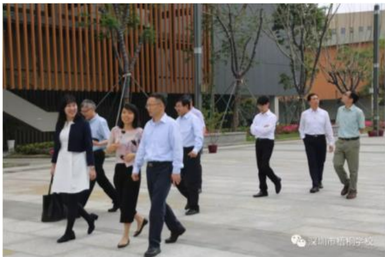
参观香港中文大学（深圳）