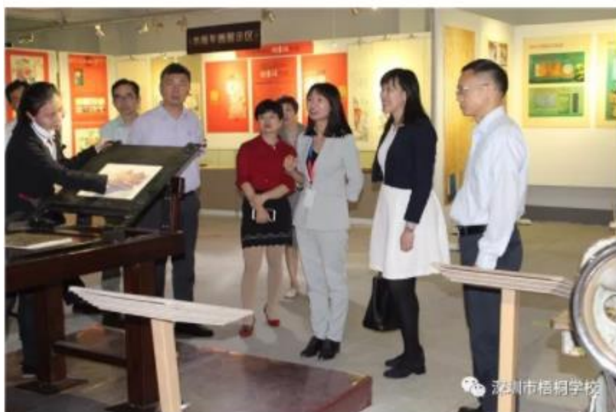
参观横岗力嘉文化创意园

本次交流活动是梧桐学校与香港姊妹学校中华基督教会基协中学互通有无、携手发展的一个新里程碑。活动不仅加深了香港教育同行对内地的了解，还增强了粤港两地的文化交流与合作，有助于促进粤港优质教育资源共建共享，进一步提升粤港教育的对外开放程度和国际化水平。