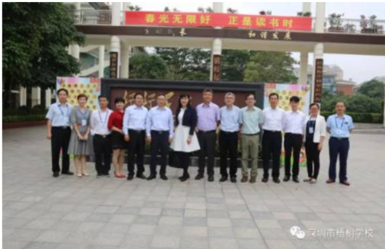
香港中华基督教会基协中学张校长一行与梧桐学校领导合影留念

https://mp.weixin.qq.com/s/kQsfkTITaXfq_PS6G7xcXA